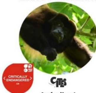
MONO AULLADOR DE MANTO O SARAGUATO