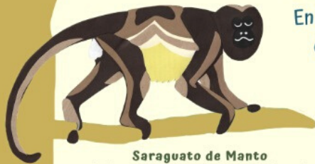
Saragato de Manto ( Alouatta palliata spp. mexicana)

COMEN, JUEGAN Y DESCANSAN EN LOS ÁRBOLES