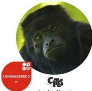
MONO AULLADOR NEGRO O SARAGUATO

Las tres especies de primates existentes en México están consideradas en peligro de extinción en la Nom059-SEMARNAT 2010