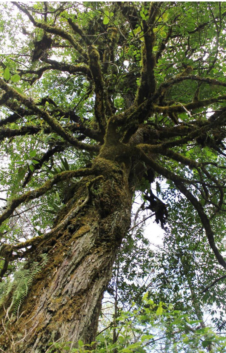
Tronco con corteza fisurada

NOMBRE CIENTÍFICO: Prunus rhamnoides Koehne