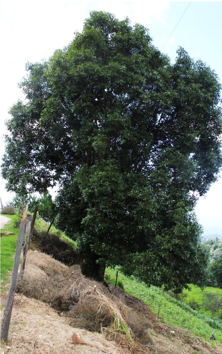
Forma de árbol