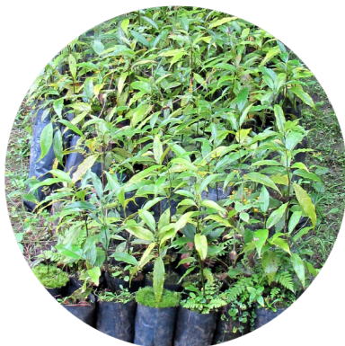
Plántulas en vivero

Frutos negros con cúpula roja indican un estado de madurez adecuado para colectarse.