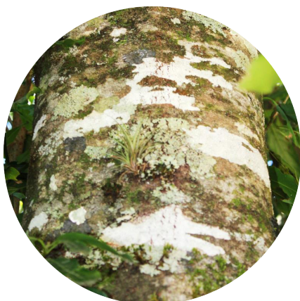
Corteza lisa y gris

NOMBRE CIENTÍFICO: Ocotea disjuncta (Schltld.) Walp.