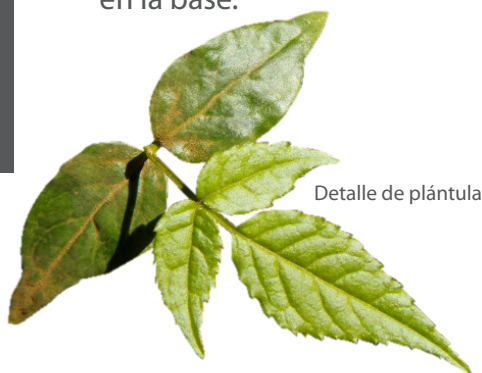
Detalle de plántula

Frutos corresponden a drupas globosas de color púrpura a negro al madurar, redondas, de 5 a 7 mm de largo, presentan una pulpa blanca que protege un pireno globoso, liso y con una marca en la base.