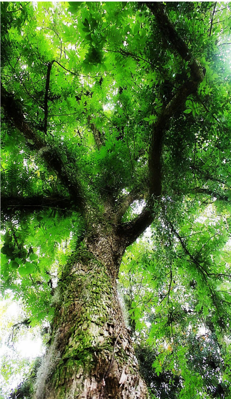
Fuste de un árbol maduro

NOMBRE CIENTÍFICO: Meliosma alba (Schltld.) Walp.