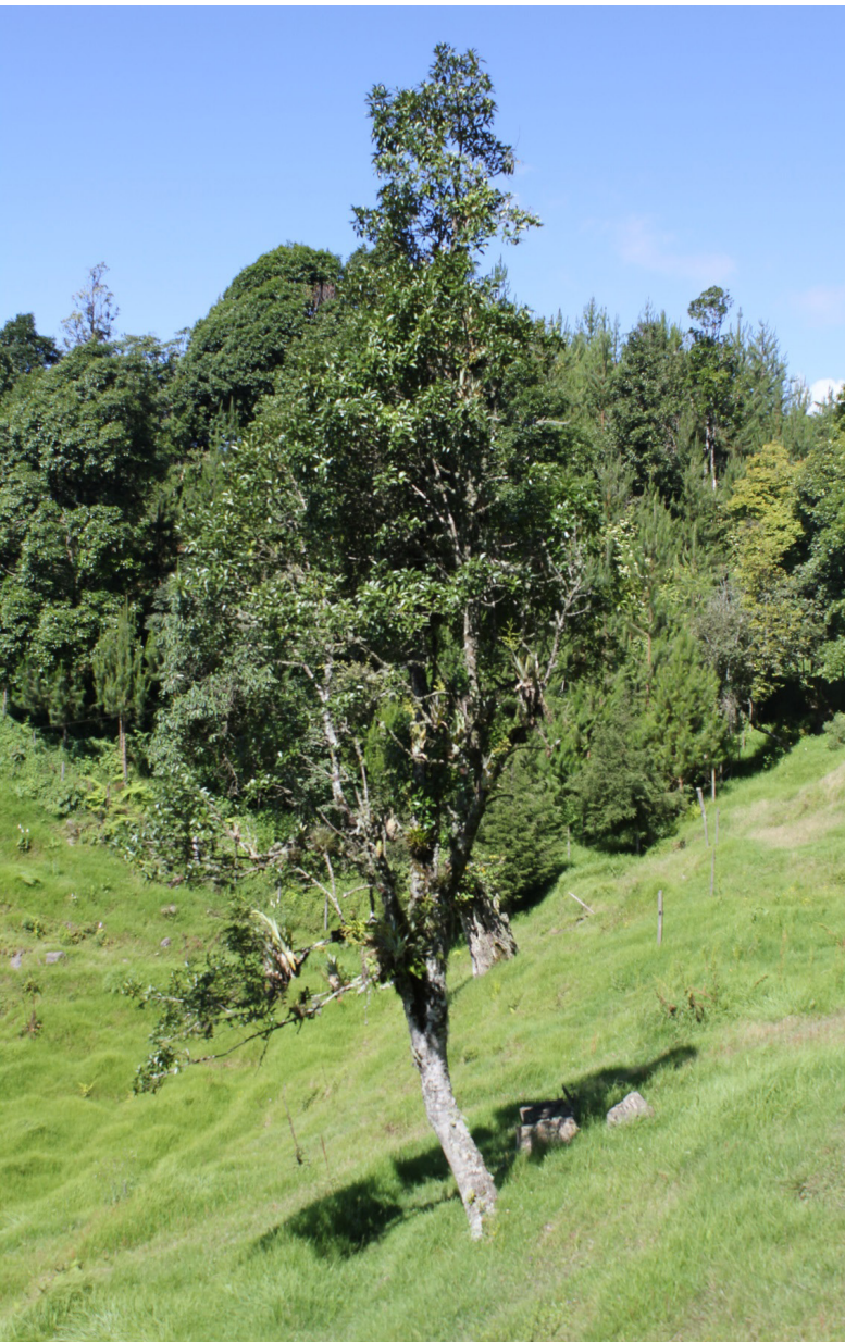
Vista de un árbol aislado en un potrero

NOMBRE CIENTÍFICO: Cartrema americana (L.) G.L. Nesom